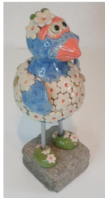
Titel: 'Cover(ed) Girl'

Van 24 t/m 27 april waren onze beelden hier te bewonderen en dat heeft men zeker gedaan. 8 van onze kunstwerken zijn naar diverse plaatsen in België 'verhuisd'.