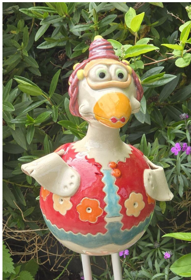
Titel: 'Daphne' (deze dame is bij Artihove te Bergschenhoek te bewonderen)

De grote beelden passen (helaas) niet in onze dompelemmer. Deze worden in een spuitcabine bespoten met glansglazuur. Daarvoor moet de cabine opgesteld en voorzien worden van handdoeken (die het eraast gespoten glansglazuur kunnen opvangen). De afzuiginstallatie is ook voorzien van 'opvang' d.m.v. wasemkapdoeken. Na het spuiten moet de gehele installatie worden ontmanteld en schoon gemaakt.